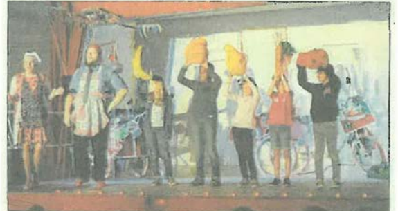
Les deux cuisiniers ont été aidés par les enfants pour une aventure gustative.

L'initiative de Calitom, la compagnie Ça s'peut pas a donné 8 représentations de son spectacle jeune public «Ratatouille Rhapsody» à la salle de fête de Brie, sensibilisant 1 500 élèves de 58 classes de Charente à la lutte contre le gaspillage alimentaire pendant quatre jours. Sidonie Beauchamp, grande cheffe étoilée, est entrée en résistance contre la «Food Corporation». Elle sillonne le monde avec sa cuisine ambulante pour retrouver les goûts et les saveurs. Colin, rockeur gourmand, va devenir son commis avec le secret espoir de pouvoir transformer la batterie de cuisine en instruments de musique. Un spectacle participatif, éducatif et amusant dans lequel le gaspillage alimentaire, les circuits courts, les fruits et légumes de saison «moches» et abimés sont mis à l'honneur.