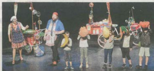
Ambiance surchauffée et haute en couleurs au théâtre Charles-Dullin

Les écoliers ont, depuis le mois d'avril, récupéré des déchets biodégradables qu'ils ont fait sécher avant de les coller sur des supports de masques. Le projet Récré s'inscrit dans le cadre du programme Territoire zéro déchet, zéro gaspillage, porté par le Smédar, la Métropole Rouen Normandie, la communauté d'agglomération Dieppe-Maritime, la communauté de communes Inter-