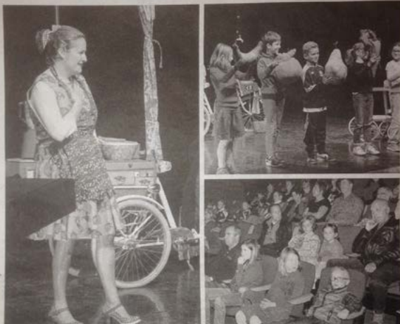
Le gaspillage était le sujet de cette pièce.

Un spectacle musical adressé aux enfants, qu'ils ont été nombreux à venir déguster en famille. La recette a fonctionné, ils ont même pu participer sur scène aux côtés des deux comédiens. Ce spectacle était la conclusion de la résidence d'artiste de la compagnie professionnelle Ça s'peut pas. Grâce à la municipalité, la troupe neuchâteloise a pu disposer du cinéma-théâtre pendant deux semaines pour concocter cette nouvelle création. En échange, elle a donc offert sa première représentation aux familles saint-saënoises.